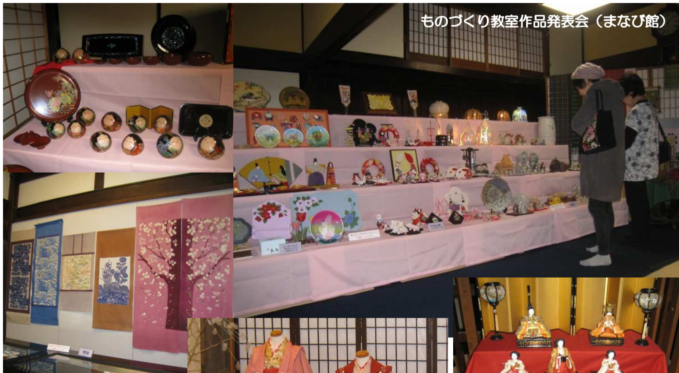
ものづくり教室作品発表会（まなび館）