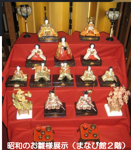
昭和のお雛様展示（まなび館2階）