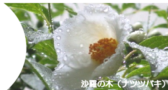
沙羅の木 (フツツバキ)