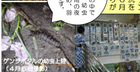
ゲンジボタルの幼虫上陸 (4月6日撮影)