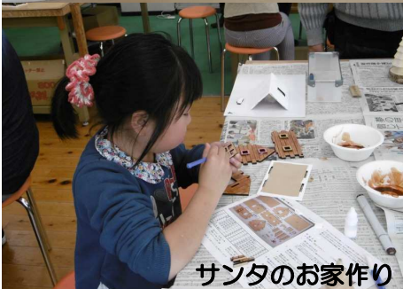
サンタのお家作り

日本でクリスマス 祝った最古の記録が 残る山口市。伝承セ ンターでは大内塗な ど伝統工芸とコラボ したツリーや、町家 の格子に明滅するイ ルミネーションなど で年の瀬のまちを彩 ります。