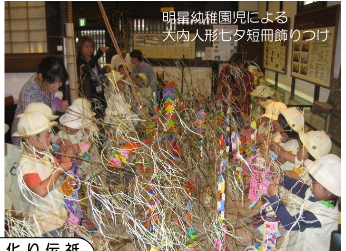
明暁幼稚園児による 大内人形七夕短冊飾りつけ

祇園祭をはじめ 伝統行事にゆかりの「大内文化」は山口のまちのルーツともいえます。