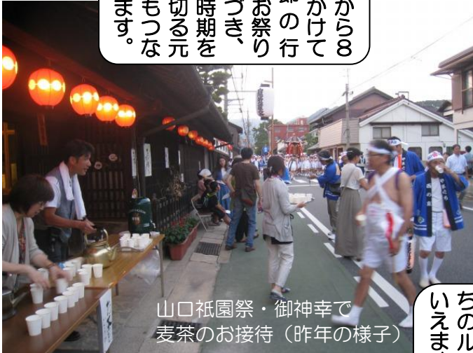
山口祇園祭・御神幸で 麦茶のお接待（昨年の様子）

7月から8月にかけて季節の行事、お祭りがつづき、暑い時期を乗り切る元気がもつな갑니다。