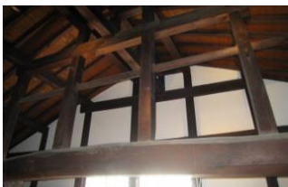
まなび館【商家旧野村家住宅・明治19年建築】