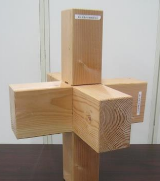
柱と足固めの車知栓仕口