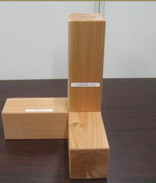
土台隅柄佐差し仕口