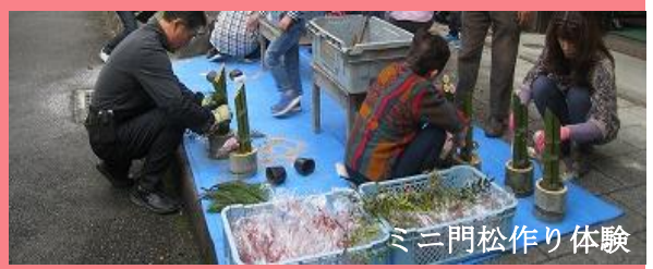
ミニ門松作り体験