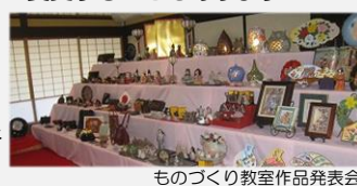
ものづくり教室作品発表会