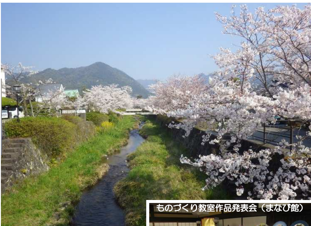
ものづくり教室作品発表会（まなび館）