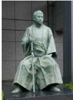
長州藩邸跡の桂小五郎像

幕末の京都では、朝廷（御所）を中心に、公家の屋敷を拠点として政局が激動した。その一つ公家近衛家の屋敷だったものを明治に木戸が購入し別邸とした。天皇の京都巡幸に従った際持病を発症し、天皇の慰問を受けるも逝去、東山霊山に葬られた。山口市糸米の旧宅跡地そばの木戸神社に、文武両道の神として祀られている。