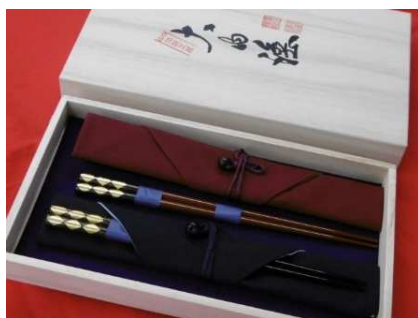
大内塗箸と箸袋セット（イメージ）

黒と大内朱の大内塗箸各2膳に携帯用箸袋付きのセットを、指定の仕様に合わせて大内塗漆器振興協同組合により制作、10セットを東京都に納品する予定です。大内塗をはじめとする各地の特産品の魅力が世界に広く伝わることを期待されます。